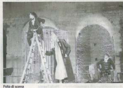
Foto di scena